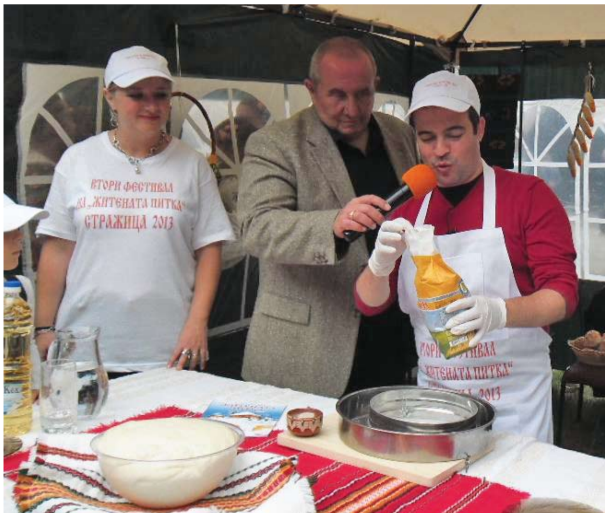
Житената питка – една от събра за Втория фестивал-най-обичаните герои на Каралийчевите приказки, вал участници от общината, гостуващи екипи от страната и 40 деца от с. Балени, обл. Дъмбовица на Република Румъния. На страница 4

методи за повишаване на ефективността, ефикасността и усъвършенстване на организационната структура. Продължава на стр. 2