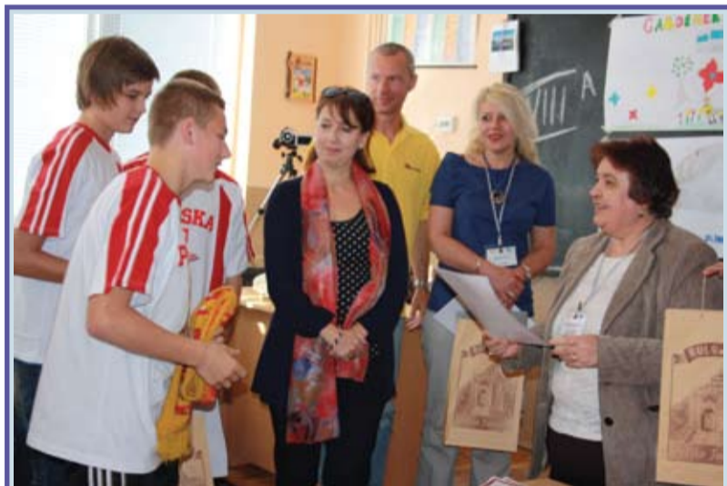
Гости от пет държави гостуваха в СОУ „Ангел Каралийчев” в Стражица На страница 2

без чужда помощ. Могат да кандидатстват и лица с по-нисък процент трайно увреждане, с установена невъзможност за самостоятелно обслужване към момента на оценката на потребностите. За помощ могат да кандидатстват и деца на възраст до 16 години с и над 50 на сто вид и степен на трайно намалена работоспособност, с определена чужда помощ или невъзможност за самостоятелно обслужване към момента на оценката. Заявления за ползване на услугата „Личен асистент” ще се подават от 11 до 15 ноември 2013 г. Продължава на стр. 2